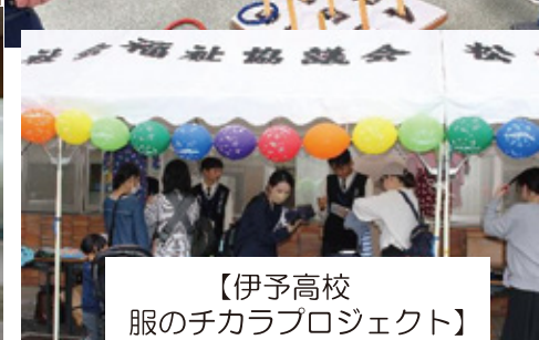
【伊予高校服のチカラプロジェクト】