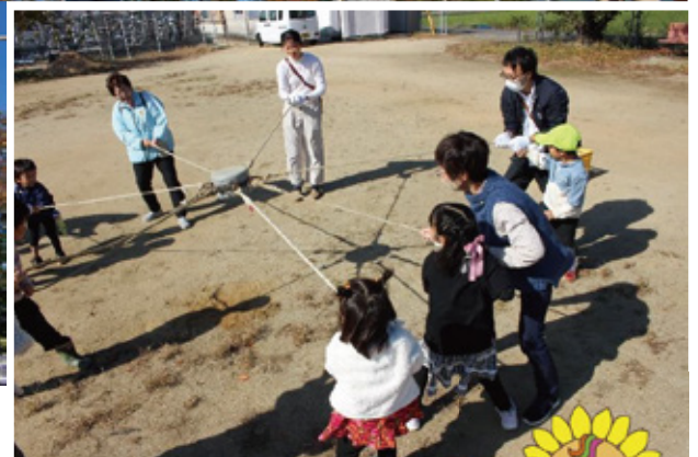
11月9日(土)に「いのこ体験会」を開催しました。(関連5ページ)