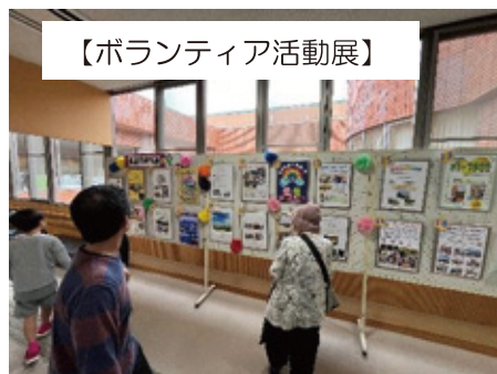
【ボランティア活動展】