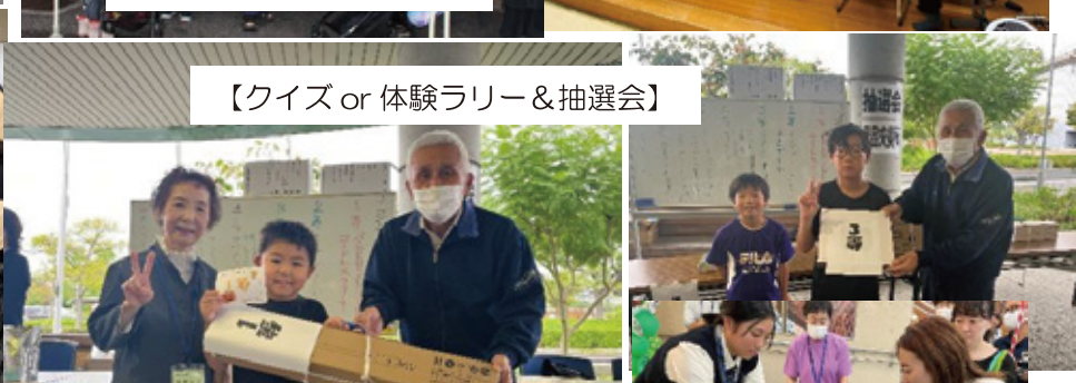
【クイズ or 体験ラリー & 抽選会】