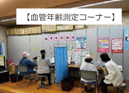
【血管年齢測定コーナー】