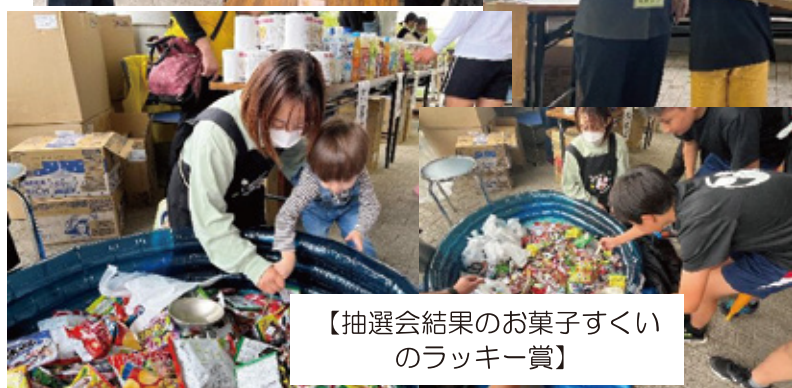
【抽選会結果のお菓子すくいのラッキー賞】