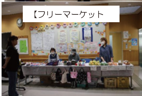
【フリーマーケット】