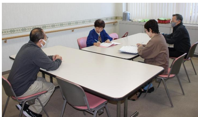
心配ごと相談所の様子