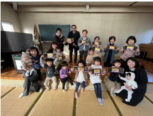
子どもと高齢者の合同のサロン活動の様子

町内にある高齢者や子どもの居場所となるサロンが地域に広がるように、講師の派遣やサロンを運営しているお世話人の支援を行ったりしています。