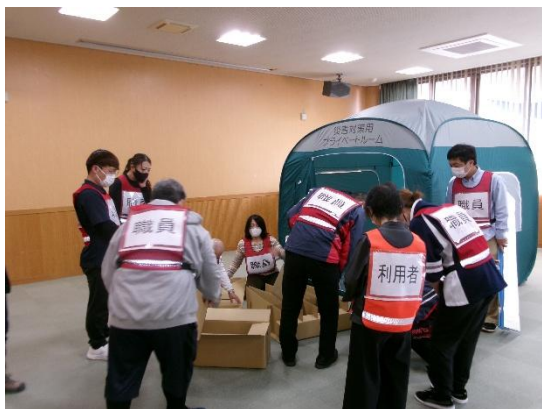
社会福祉法人と連携しての福祉避難所開設訓練