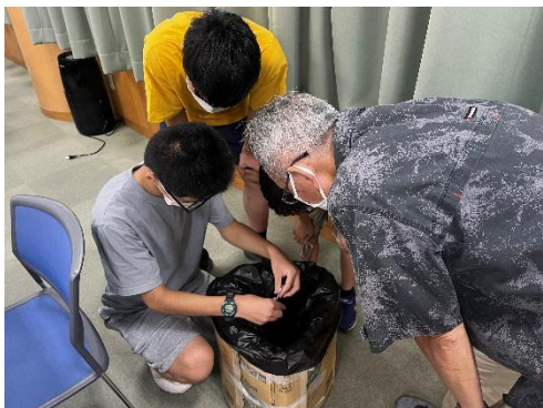
ボランティア講座(災害講座)