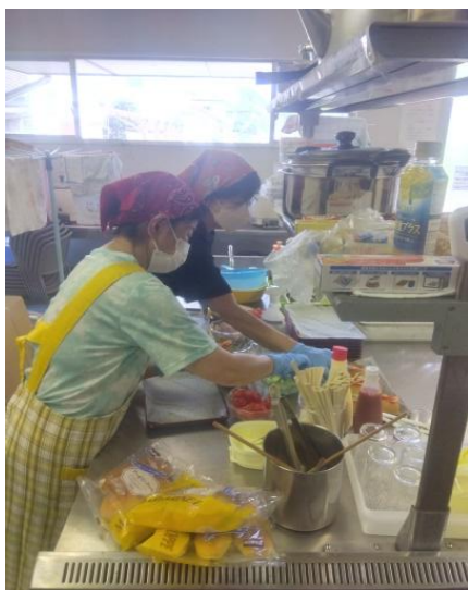
ボランティア団体「西高柳支え合いサークル」の活動の一部である地域食堂の様子