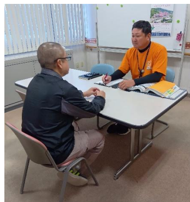
生活困窮者の自立相談の様子