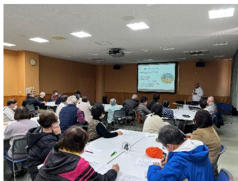
ボランティア講座(傾聴講座)

ボランティアの相談・登録・斡旋業務では、ボランティア活動をしてみたい方や支援を必要とする方・団体とのマッチングを行い、地域における支え合い活動を推進します。また、ボランティアに関心を持っていただけるよう、各種ボランティア講座や研修会を開催し、活動のきっかけづくりと人材育成に取り組めます。