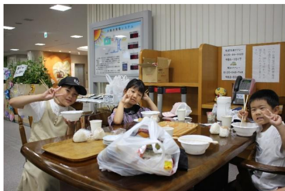
町内の地域食堂の様子

松前町に地域食堂が広がるように松前町社会福祉協議会も他の社会福祉法人と協力して地域食堂を月に一回程度開催しています。