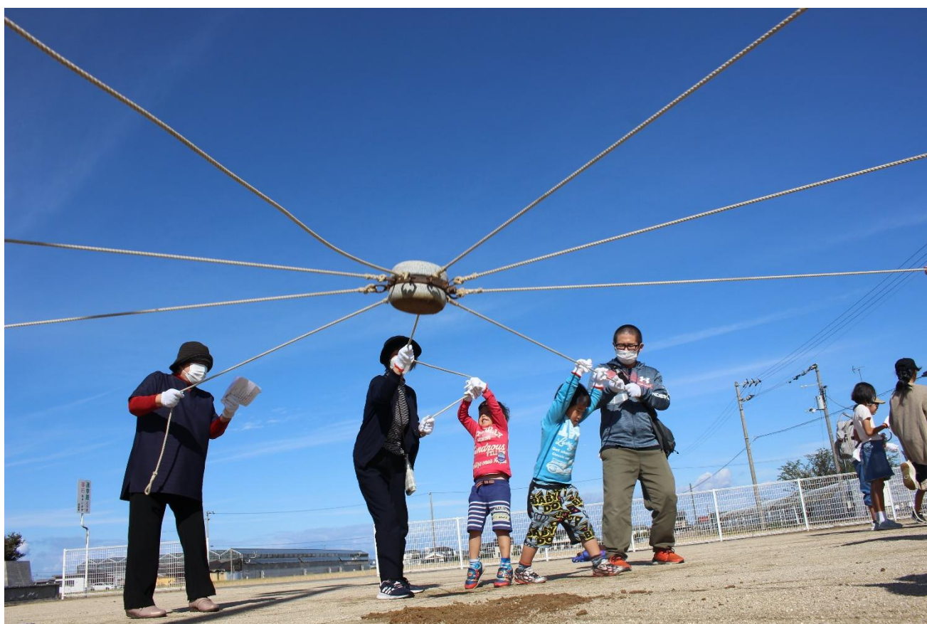
北伊予校区で開催された「いのこ体験会」の様子