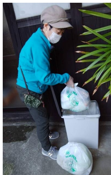
ボランティアによるゴミを捨てるのが困難な方への支援活動

地域で活動されている支え合い活動を松前町で広げるために、活動の支援や広報、社会福祉大会などで紹介を行います。