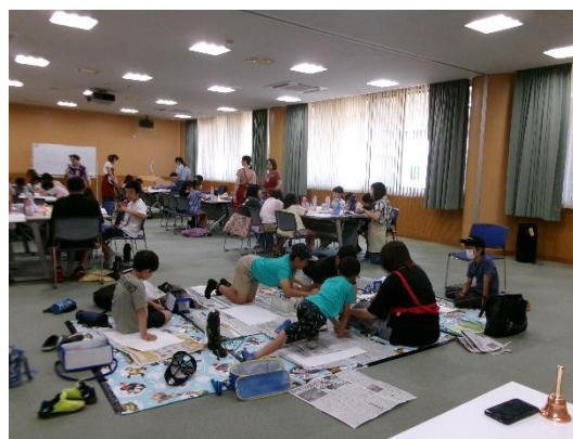
ボランティア団体と社会福祉法人の協働した夏休み勉強会の開催

町内の社会福祉法人やボランティア団体、学校などと連携して地域の居場所づくりの活動を広げるために地域食堂を実施します。