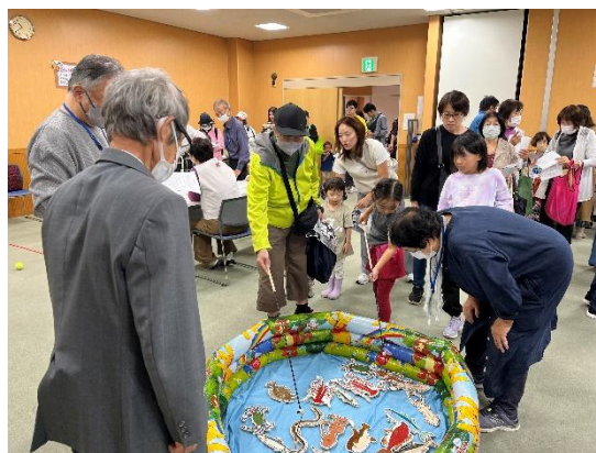
福祉ふれあいフェアの様子