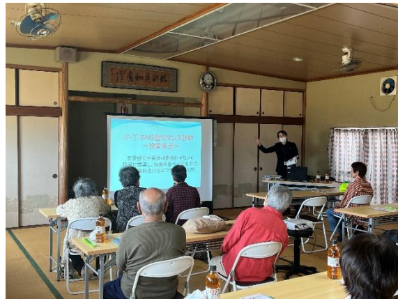
町内にある高齢者の居場所の様子