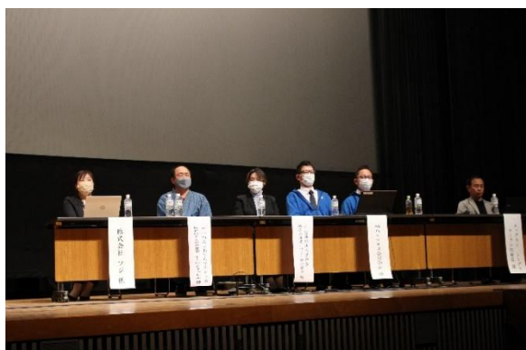
松前町社会福祉大会の様子

福祉に関する情報などを、「松前町社会福祉協議会ホームページ」、「社協だより」や「インスタグラム」で情報を発信します。