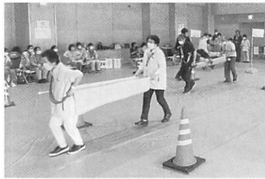
担架を作って、搬送リレーを行いました