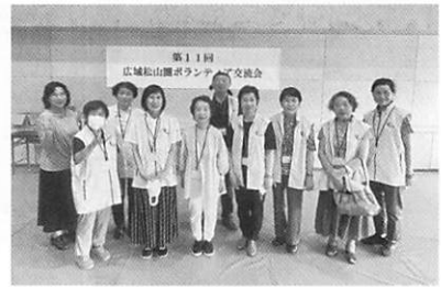
参加されたメンバーさんです