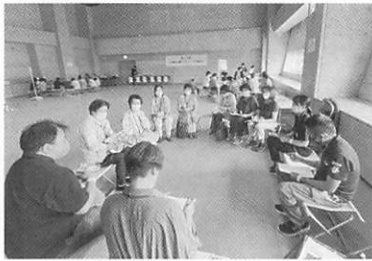
情報交換を行っています！！

7月15日(土)に第11回広域松山圏ボランティア交流会 in 伊予市に松前町ボランティア連絡協議会の会員が参加されました。この交流会は、広域松山圏の6市町のボランティア連絡協議会の会員が一同に会し、圏内のボランティア活動の活性化を図ることを目的に行っています。今回の交流会は、夏から秋にかけて多く発生する災害に備えて、防災をテーマに行われました。さらに、他の市町とのボランティア活動についての情報交換も行うことができました。参加された方からは、コロナ禍のためボランティア活動の制限や縮小があり活動が思うようにできなかった時期がありましたが、自分たちが出来ることをコツコツと行うことを学ぶことができました、などの声があがっており、これからのボランティアについて考えることができる良い交流会になったと思います。