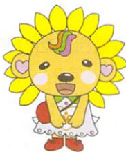
松前町社会福祉協議会 イメージキャラクターひまわん

小地域福祉活動計画は、各校区ごとに展開される地域福祉活動の推進を目指し、住民の皆様と松前町社会福祉協議会が中心となり、身近な生活課題の解消に向けた具体的な取り組みをまとめたものです。