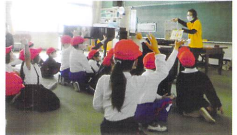
学校での朗読ボランティアの様子

ボランティアを始めようと思ったのは、2000年の時で、自身の子どもたちが高校生以上になり、時間の余裕が出来た時に子どもたちが地域の方々に行事等でとてもお世話になったので、地域のために何かしたいと考えていました。そんな時、社協だよりの朗読ボランティア講座の募集を見て、受講後そのまま「朗読ボランティアグループ SAY」に加入し、ボランティアを始めたのがきっかけになります。