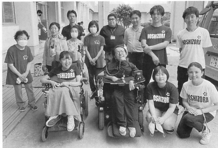
協力していただいた皆様です