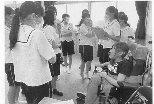
生徒さんと談笑中