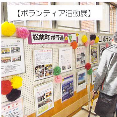
【ボランティア活動展】