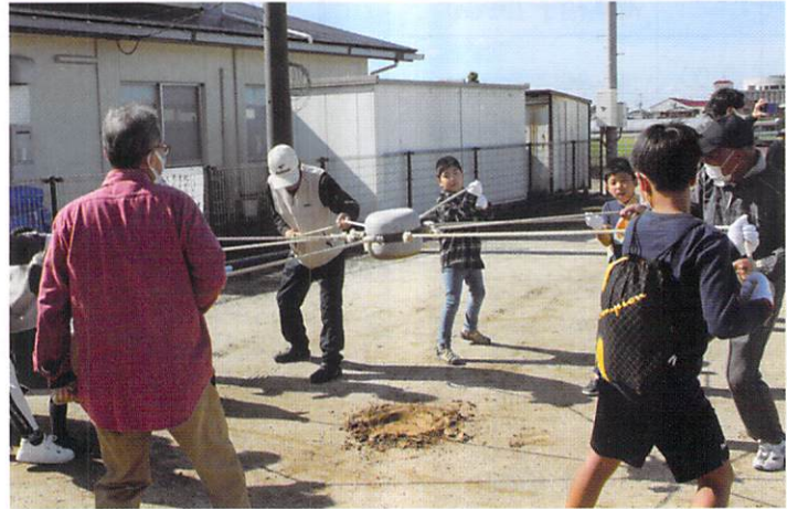
11月11日（土）に開催した「いのこ体験会」の様子です（関連5ページ）