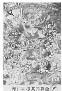
赤い羽根共同募金