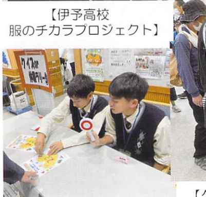
【伊予高校 服の子カラプロジェクト】