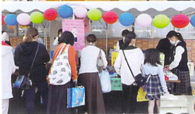
【フリーマーケット】