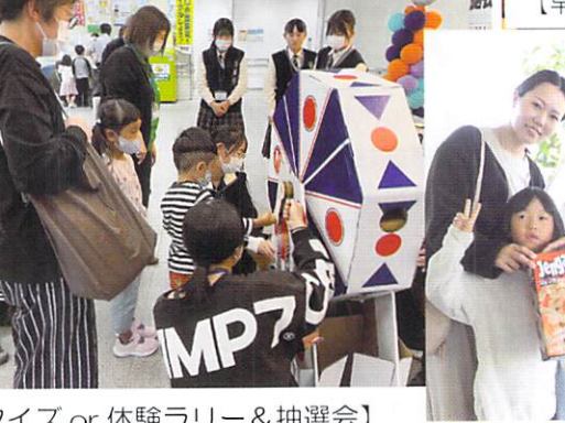
【クイズ or 体験ラリー&抽選会】