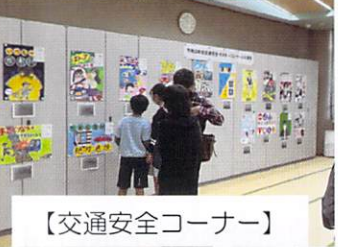
【交通安全コーナー】