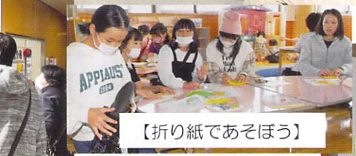
【折り紙であそぼう】