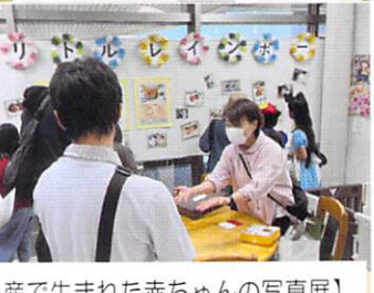
【早産で生まれた赤ちゃんの写真展】