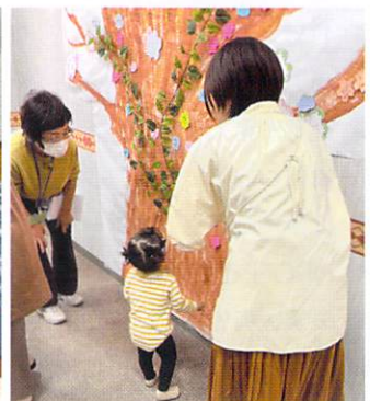
【メッセージツリー】